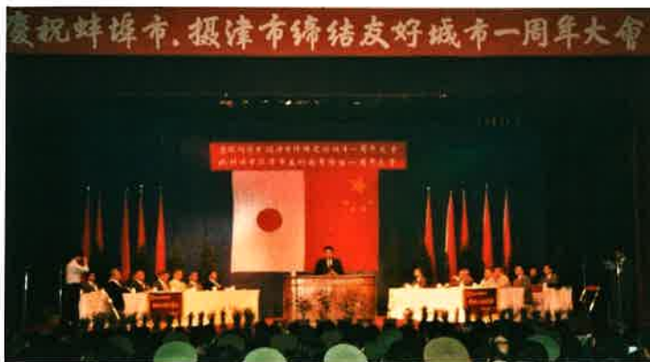
図4 摂津市・蚌埠市友好都市締結一周年記念大会(蚌埠市にて)

蚌埠市は正に日中関係史の光と影を背負いながら発展してきた代表的な近代都市です。1949年の中華人民共和国成立以降、蚌埠市は安徽省第一の工業基地になり、摂津市と友好交流を始めた80年代には全国的にもトップの経済産業力を誇る都市でした。摂津市との友好交流も、1990年代までは経済貿易関係がメインでしたが、2000年以降は文化・教育面での交流が増えていきます。