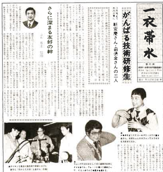
図1 「がんばる技術研修生」(『一衣帯水』第2号、1986)

中国安徽省の北東部に位置する蚌埠市は摂津市が締結した最初の友好都市です。1972年9月に日中国交正常化がはかられ、1978年に日中平和友好条約が結ばれたのを契機として、両国間で都市単位の友好交流が盛んになっていきます。摂津市と蚌埠市の友好交流は1980年から始まり、84年5月5日に友好都市締結に調印しました。両市の友好都市締結は大阪府下では四番目、日本全国で見ても比較的に早い段階のものです。