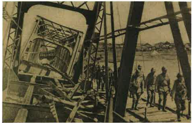
図3 爆破された淮河大鉄橋の横を歩く日本軍

このように、蚌埠は戦争に翻弄されながら急速な近代化を遂げ、1947年には正式に市として設置され、行政において鳳陽県から離脱し、安徽省下最初の市制を歩み始めました。