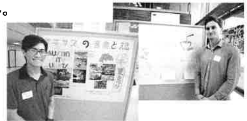
(写真は前期の留学生です)